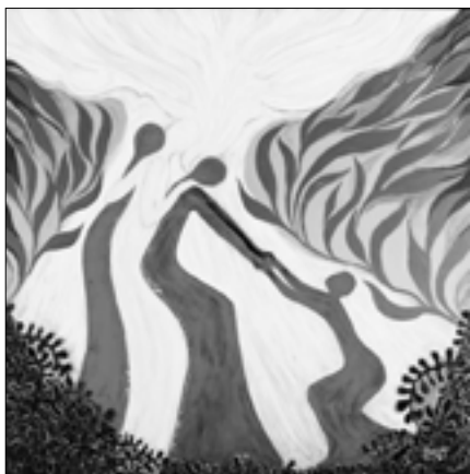
Abbildung: „Justice“: Hanna Cheng/Tropische Blicke/Asia Weltgebetstag der Frauen – Deutsches Komitee e.V.

Habakuk, der in seiner Klage – auch gegen Gott – heftig austeilen kann, ermutigt die Christinnen, auch ihrerseits im Gebet ihre Kla-